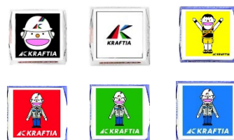
オリジナルデザインチロルチョコ (全6種)