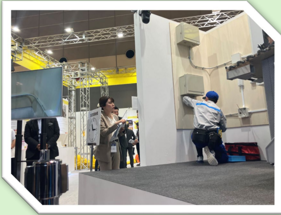
技能五輪選手による実演