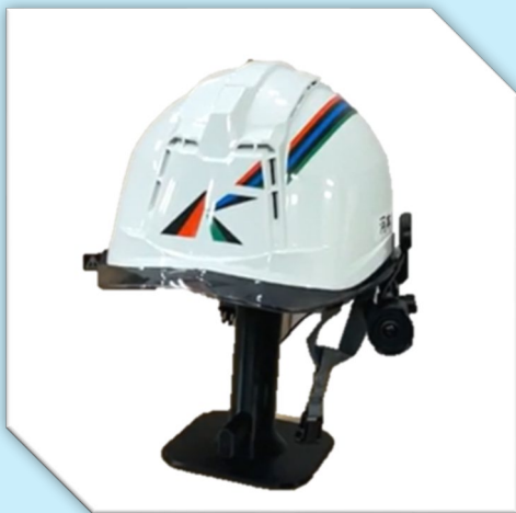
AI 機能搭載型ウェアラブルカメラ (クラフティアモデル・保安帽取付)