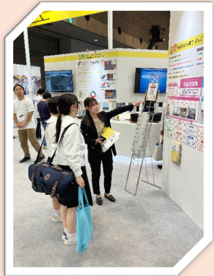
学生向け採用説明