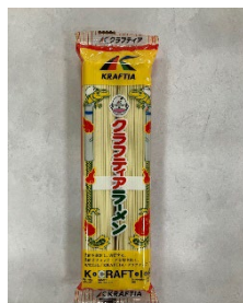
マルタイ棒ラーメン (オリジナルデザイン)